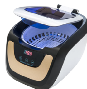
CE-5700A con cestello standard

L'intuitività e la sua versatilità di utilizzo lo rendono un elemento indispensabile per ogni laboratorio.