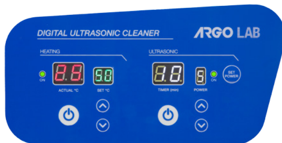
Pannello frontale serie DU

Tutti i modelli sono forniti di cestello a rete in acciaio inox, coperchio in acciaio inossidabile e detergente di pulizia universale