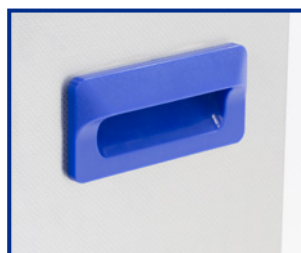
Maniglia per il trasporto