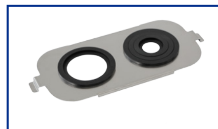
Supporto Becker per DU-45; DU-65; AU-65