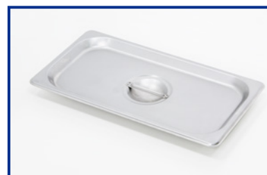
Coperchio in acciaio inox