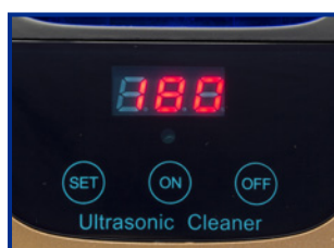
Pannello di controllo