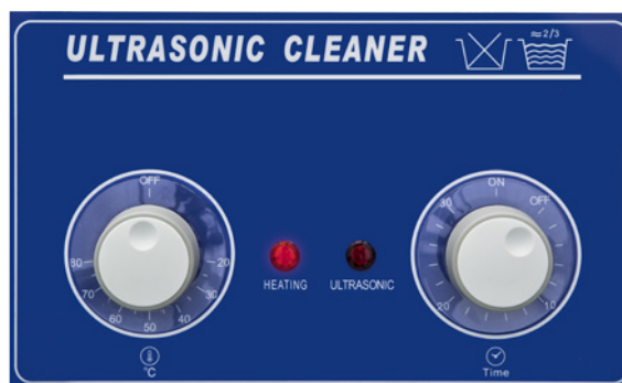
Pannello frontale serie AU