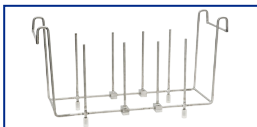
SS-200 supporto per la pulizia dei setacci (solo mod. AU-450)

* Tutti i supporti per becker sono forniti con anelli in plastica diam: 91,7 - 72,0 - 52,0 - 32,5 mm