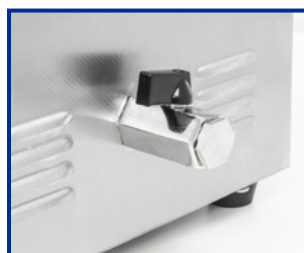
Valvola di scarico per i modelli DU-100 e AU-450