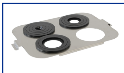
Supporto Becker per DU-100