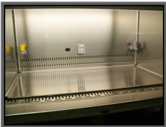
Piano di lavoro DI SERIE, intero a bacinella