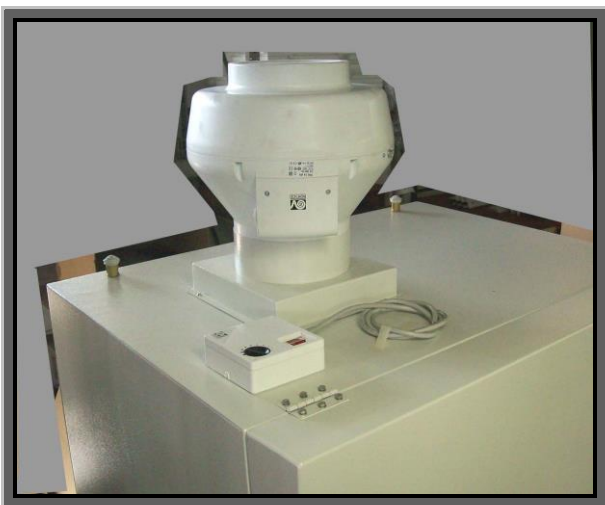
Ventilatore supplementare con gruppo interruttore / regolatore di velocità, posizionati sul tetto della cappa.