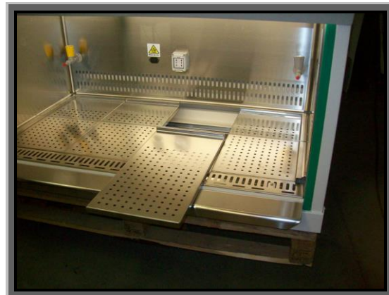
SOLO A RICHIESTA: piano di lavoro forato, suddiviso in settori removibili e autoclavabili)