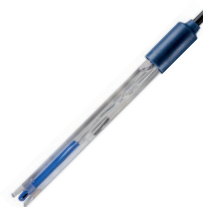
201 T DHS

Elettrodo digitale di pH combinato con tecnologia DHS.