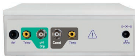
Pannello posteriore PC 50 VioLab

Il segnalatore LED permette di tenere sempre sotto controllo lo stato dello strumento.