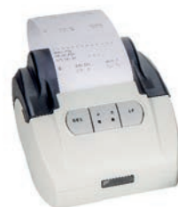
Stampante RS 232