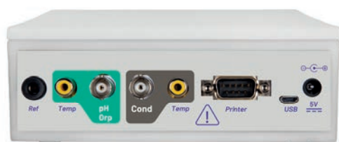
Pannello posteriore PC 60 VioLab