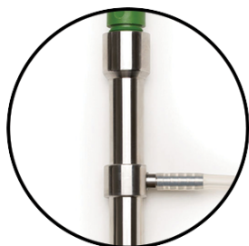
Cella di flusso in acciaio inox AISI 316

HI98197 è un robusto strumento portatile EC/TDS/Resistività/Salinità con prestazioni e caratteristiche di uno strumento da banco. Questo strumento professionale, a tenuta stagna è conforme agli standard IP67. HI98197 viene fornito con una valigetta rigida per il trasporto, completo di tutti gli accessori per misurare il grado di purezza dell'acqua. Gli accessori includono una cella di flusso in acciaio inox ed una sonda di conducibilità a 4 anelli con un raccordo filettato, che permette di effettuare misure con un'elevata risoluzione di conducibilità (0.001 \text{S/cm} ) e di resistività (0.1 \text{M}\Omega \cdot \text{cm} ).