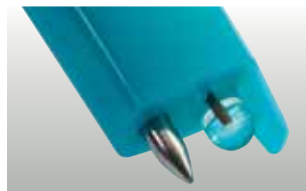
testo 206-pH1: Sonda pH1 per liquidi