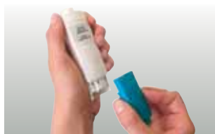
Semplice sostituzione delle sonde con testo 206-pH1/-pH2/-pH3