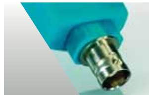
testo 206-pH3: Sonda pH3 con interfaccia BNC