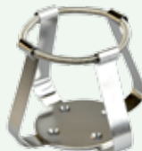
Clips per beute 200/250 ml Codice 22006483