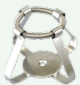
Clips per beute 100 ml Codice 22006473