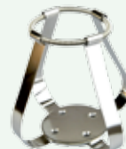
Clips per beute 500 ml Codice 22006493