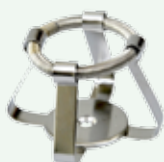
Clips per beute 50 ml Codice 22006463