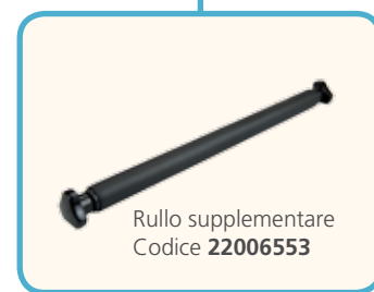
Rullo supplementare Codice 22006553